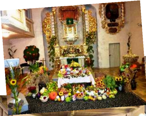
Bilder vom Gottesdienst zum Erntedankfest in Gottesgründ und Fraureuth