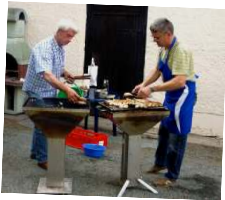
Grillfest der Kirchengemeinde auf dem Pfarrhof