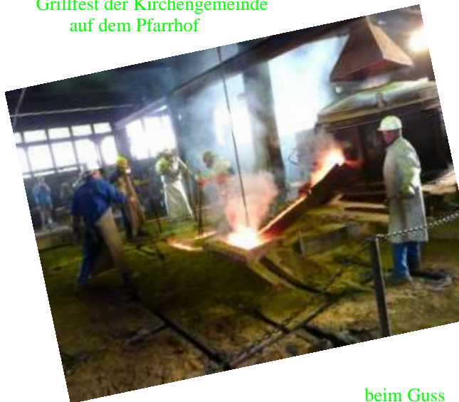
beim Guss unserer neuen kleinen Glocke