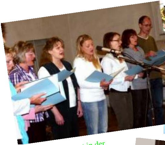
Sommerkonzert in der Fraureuther Kirche