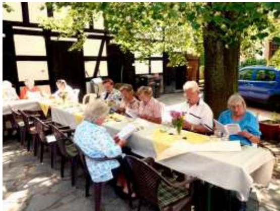
zum Sommerfest des Seniorenkreises