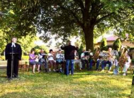
Johannisfeier auf dem Friedhof