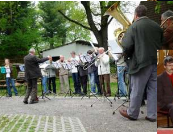
Himmelfahrt auf dem Beiersdorfer Pfarrhof