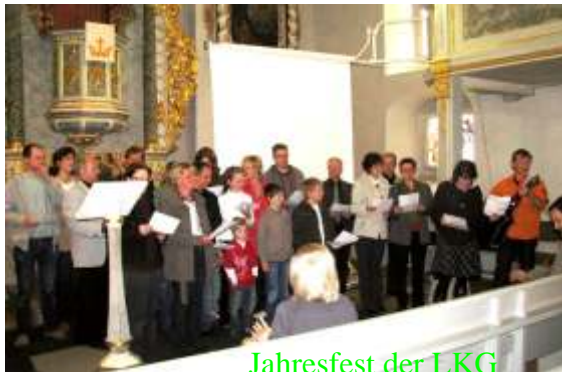
Jahresfest der LKG