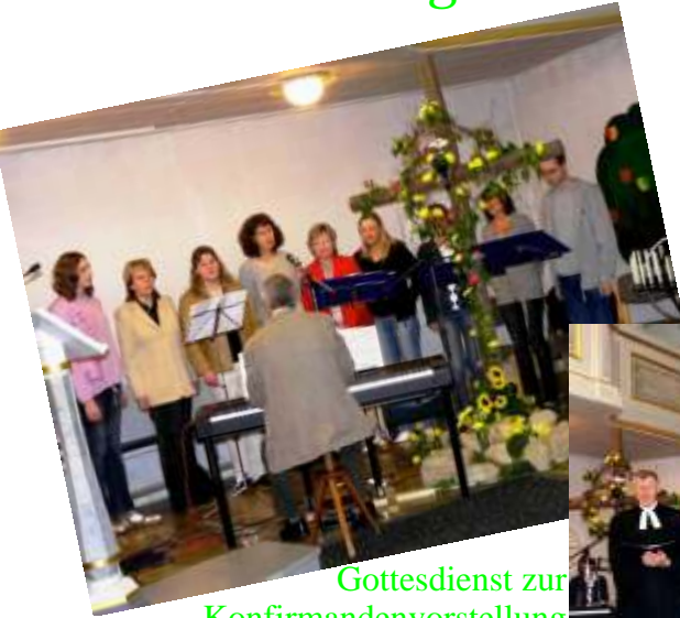
Gottesdienst zur Konfirmandenvorstellung