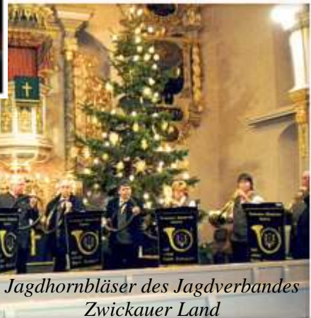
Jagdhornbläser des Jagdverbandes Zwickauer Land