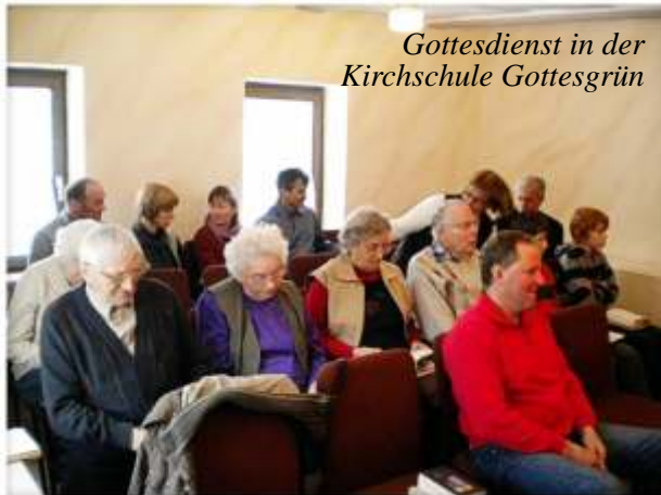
Gottesdienst in der Kirchschule Gottesgrün